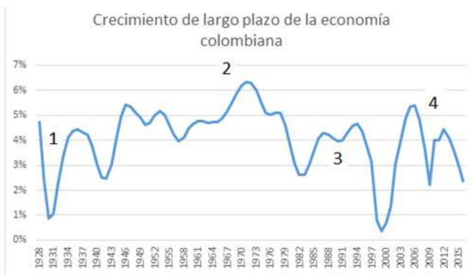
Tabla 1. Tendencia crecimiento real de la economía colombiana (1925-2016)

Fuente: Elaboración propia datos DNP-DANE. La tendencia del crecimiento del PIB colombiano, es decir, el crecimiento de largo plazo se calculó con el filtro Hodrick-Prescott (HP) de la serie de crecimiento del PIB real.